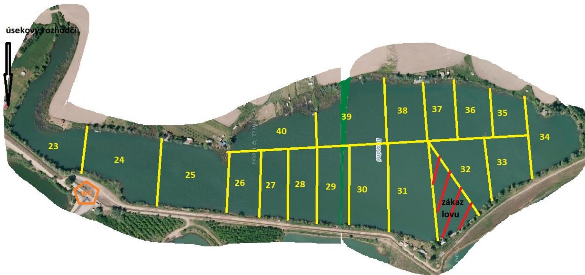
Obr. 2: Mapa lovného úseku Bezedná se zakreslením a označením jednotlivých lovných sektorů.