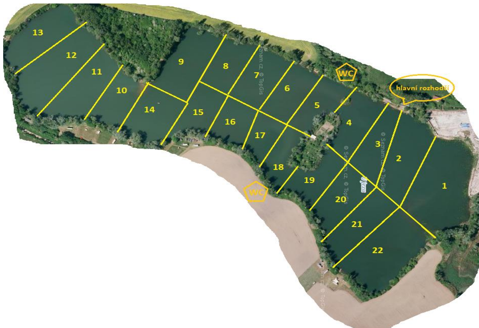
Obr. 1: Mapa lovného úseku U jezu se zakreslením a označením jednotlivých lovných sektorů.